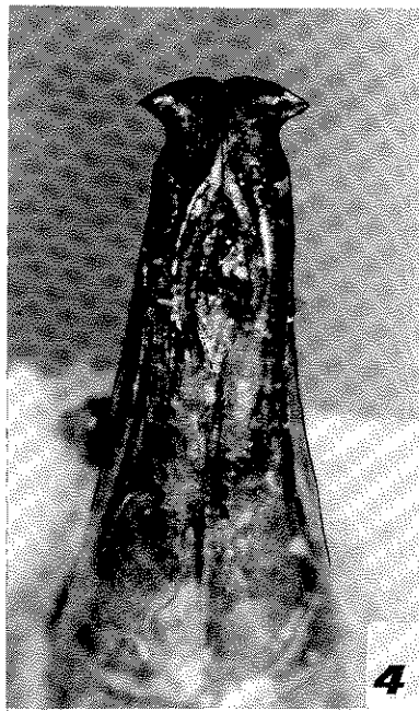
Figs. 1-4: Parameri in visione dorsale di: 1, Popillia ferreroi n.sp. 2, Popillia birmanica Arrow. 3, Adoretosoma bruschi n.sp. 4, Adoretosoma fusipes Heller.